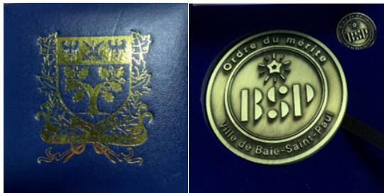
Le coffret et la médaille de l'Ordre du mérite de Baie-Saint-Paul offerts au récipiendaire

https://www.baiesaintpaul.com/ville/conseil-de-ville/ordre-du-merite-de-baie-saint-paul